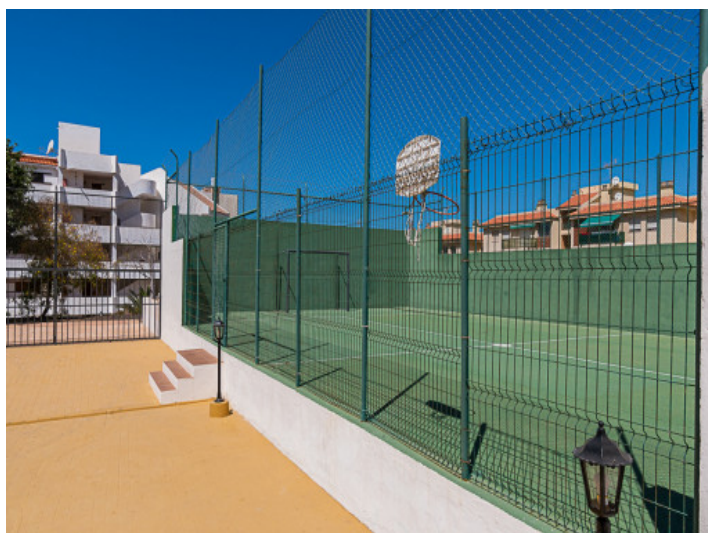
Àrea de tenis