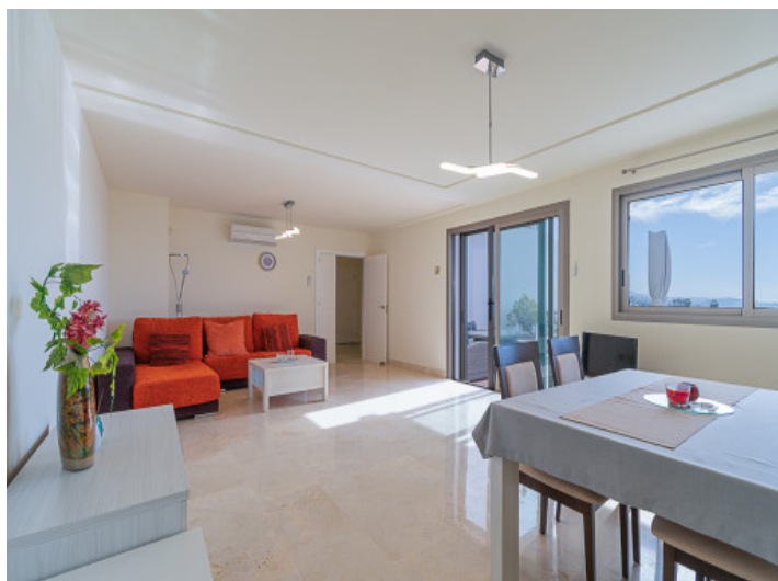
Salón - comedor