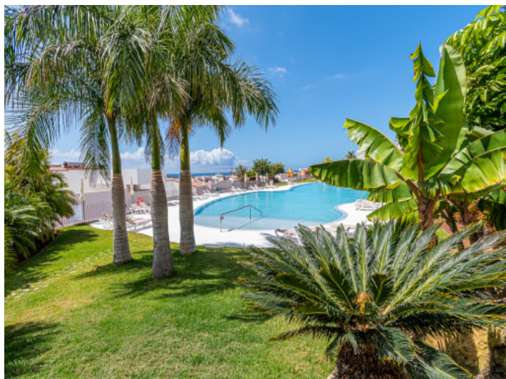
Jardin y piscina