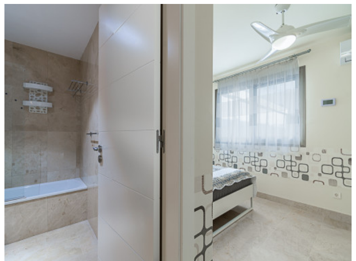
Dormitorio con baño en suite

Toda la información como mejor se puede saber, salvo por error durante el periodo de venta. Sirva este documento como un informe previo, las bases legales solo serán válidas a través de un contrato de compra acordado ante Notario.