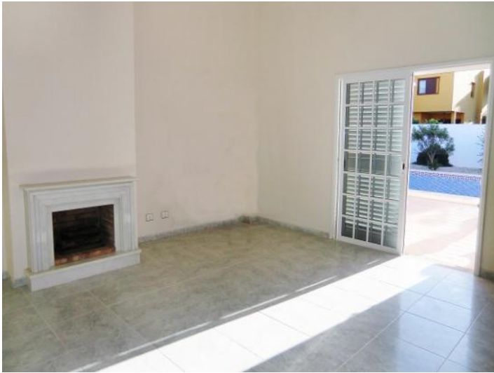
Salón luminoso con chimenea y acceso a terraza