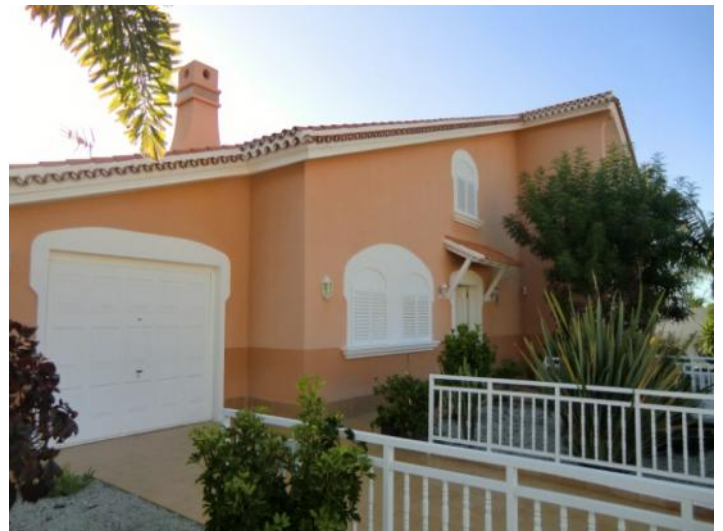
Vista al jardín delantero y al garaje