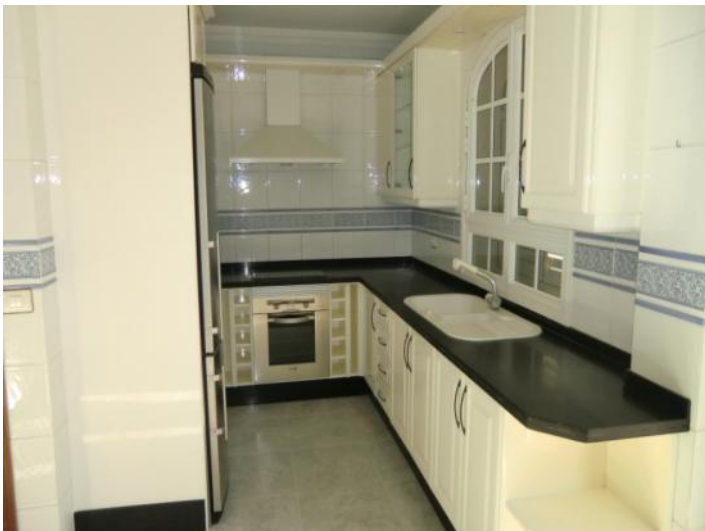
Cocina con estilo y totalmente equipada