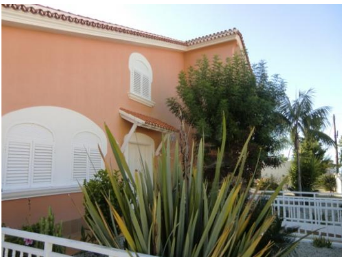
Acceso a la entrada principal y al jardín plantado delante de la casa