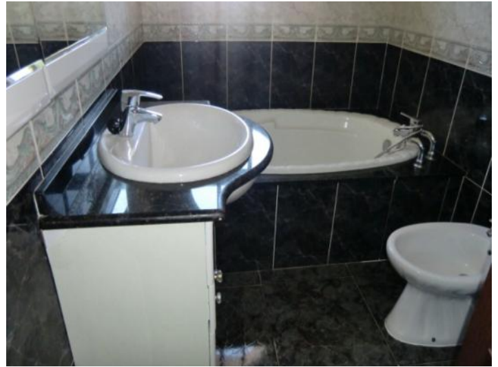
Cuarto de baño elegante con bañera