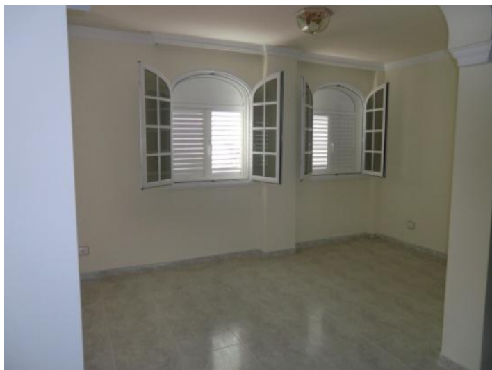
Salón acogedor y luminoso