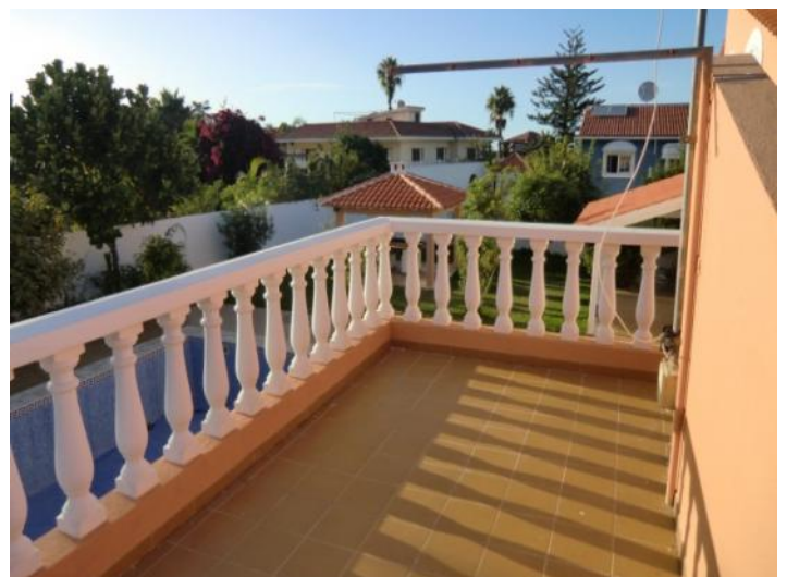
Vistas hermosas a la piscina y la zona verde

Toda la información como mejor se puede saber, salvo por error durante el periodo de venta. Sirva este documento como un informe previo, las bases legales solo serán validas a traves de un contrato de compra acordado ante Notario.