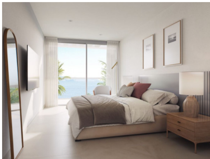
Dormitorio con ventanas grandes