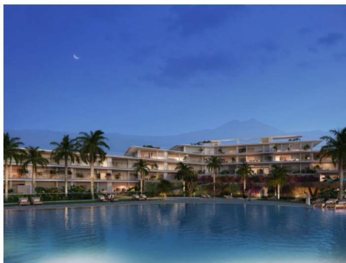
Àrea de piscina