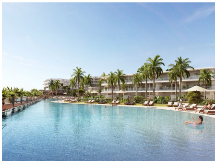
Àrea de piscina soleada