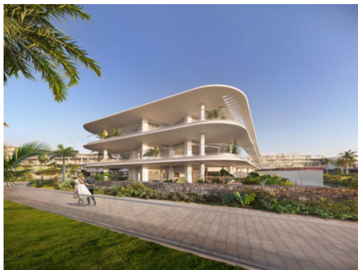
Vistas al edificio

Toda la información como mejor se puede saber, salvo por error durante el periodo de venta. Sirva este documento como un informe previo, las bases legales solo serán validas a traves de un contrato de compra acordado ante Notario.