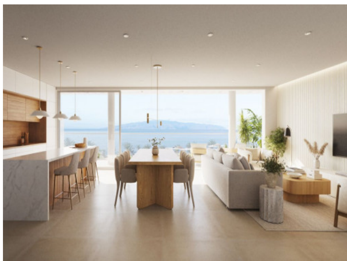
Vistas a la cocona