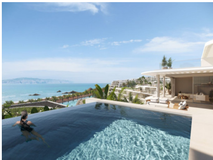
Azotea con piscina