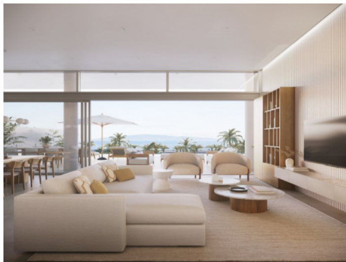
Salón y comedor abierto