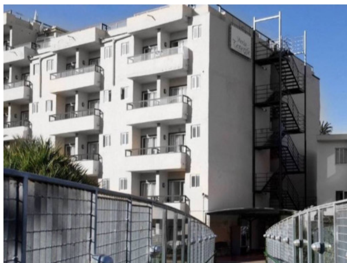
Fachada del edificio

Toda la información como mejor se puede saber, salvo por error durante el periodo de venta. Sirva este documento como un informe previo, las bases legales solo serán válidas a través de un contrato de compra acordado ante Notario.