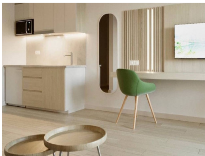
Diseño interior contemporáneo