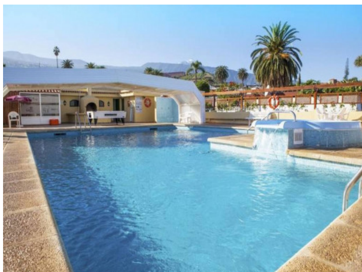
Amplia piscina comunitaria