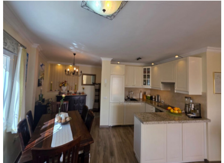
Cocina y comedor