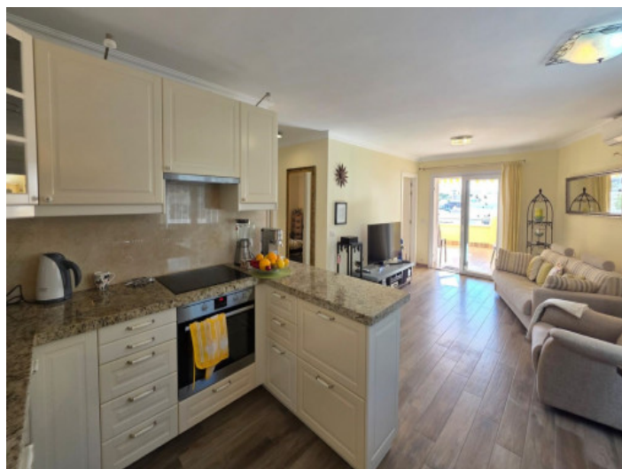
Cocina y salón

Toda la información como mejor se puede saber, salvo por error durante el periodo de venta. Sirva este documento como un informe previo, las bases legales solo serán validas a traves de un contrato de compra acordado ante Notario.