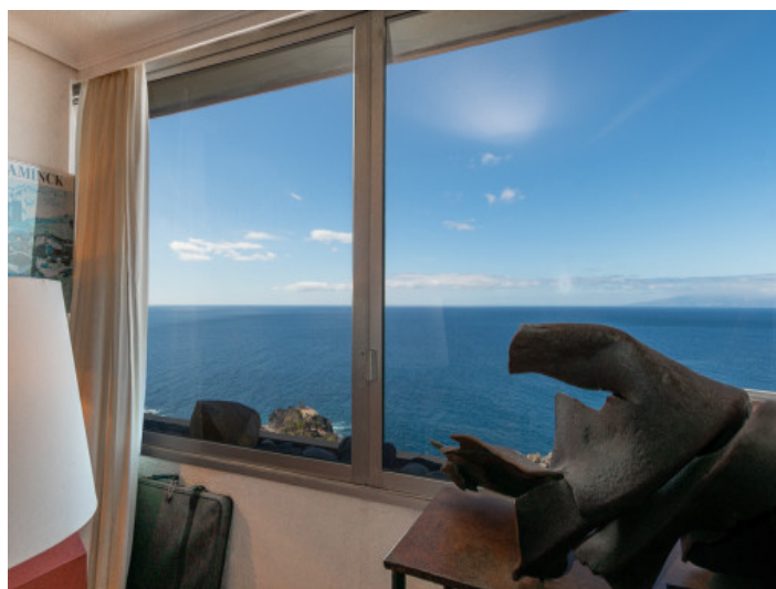
Vista al mar