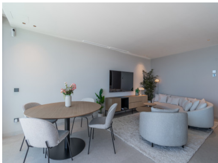
Salón y comedor

Toda la información como mejor se puede saber, salvo por error durante el periodo de venta. Sirva este documento como un informe previo, las bases legales solo serán válidas a través de un contrato de compra acordado ante Notario.