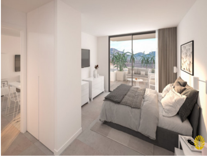
Uno de 2 dormitorios