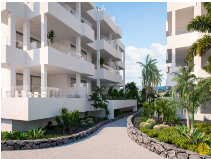
Entrada al complejo