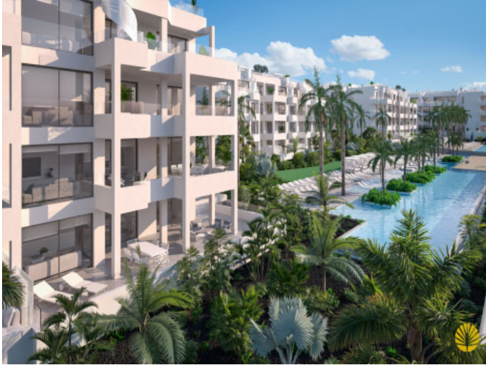
Palma Real Suites – Apartamento de lujo de 2 dormitorios en Palm Mar