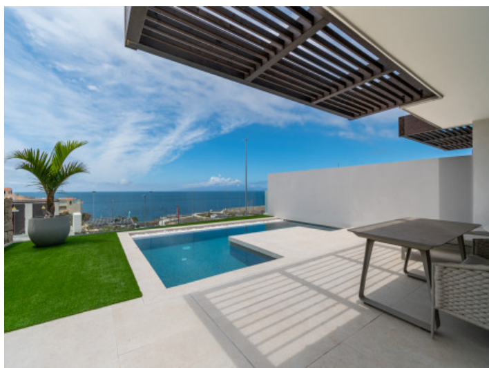
Piscina y terraza