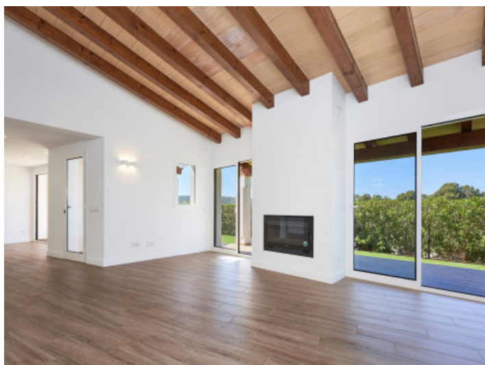
Salón luminoso con techos altos