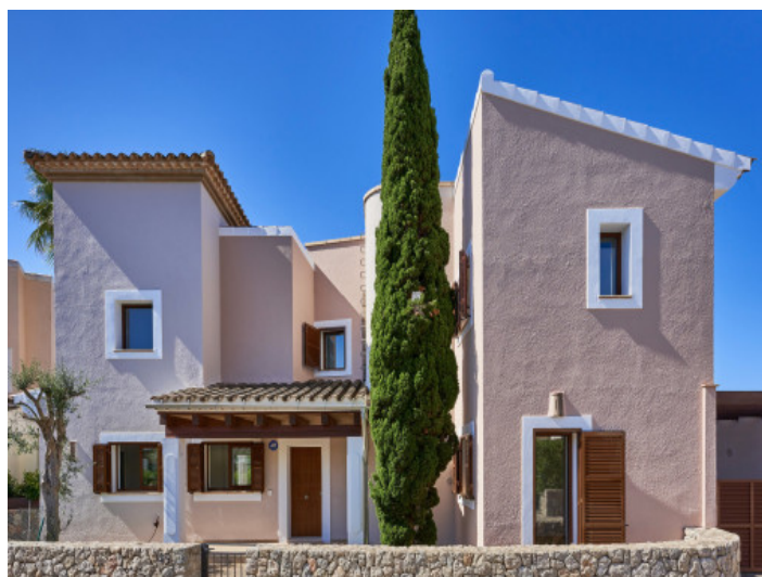
Vivienda exclusiva junto al campo de golf de Santa Ponsa – donde el