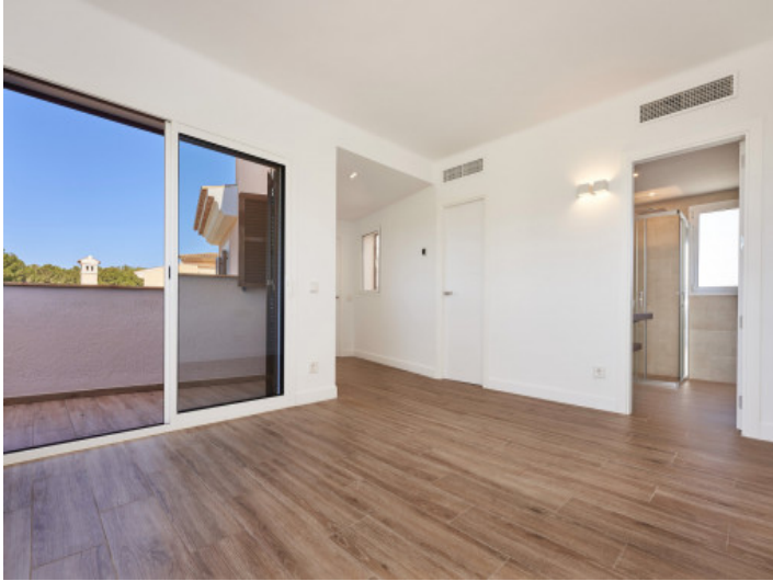
Uno de los tres dormitorios