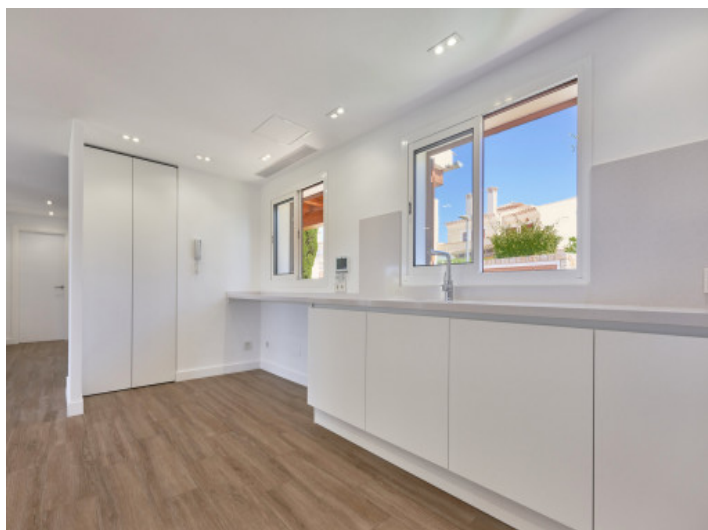
Cocina moderna semiabierta