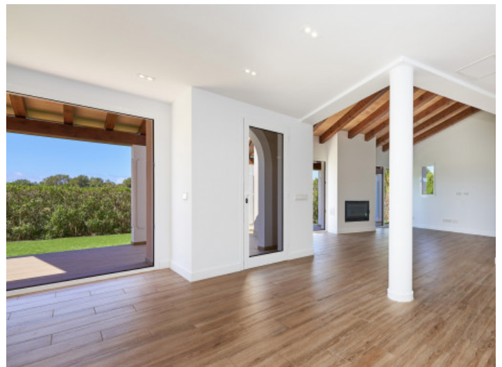
Salón muy luminoso con acceso al jardín

Toda la información como mejor se puede saber, salvo por error durante el periodo de venta. Sirva este documento como un informe previo, las bases legales solo serán válidas a través de un contrato de compra acordado ante Notario.