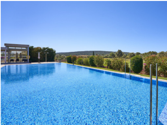
Gran piscina comunitaria con vistas al campo de golf