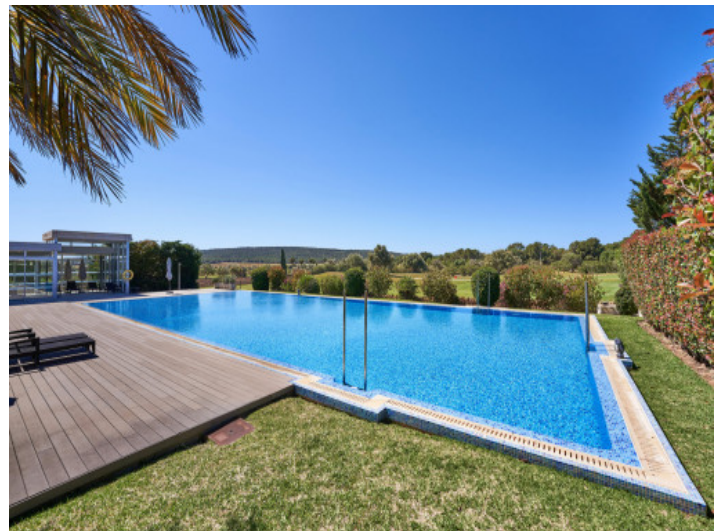
Amplia zona comunitaria