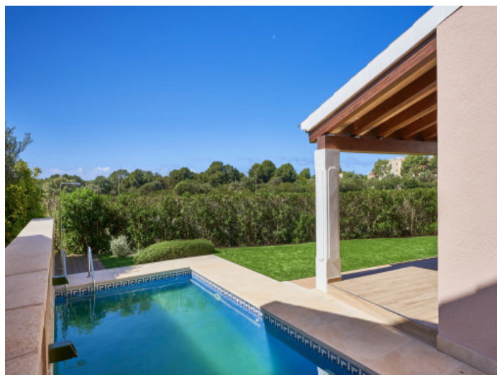
Jardín privado con piscina

Toda la información como mejor se puede saber, salvo por error durante el periodo de venta. Sirva este documento como un informe previo, las bases legales solo serán válidas a través de un contrato de compra acordado ante Notario.