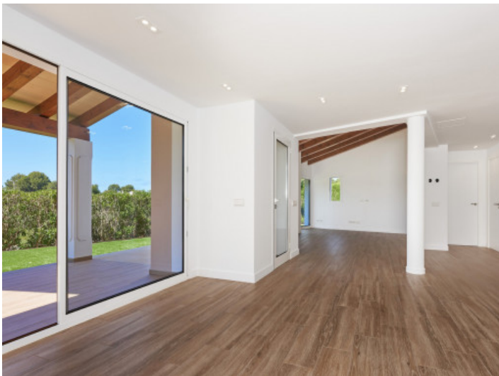
Luminoso salón-comedor con acceso al jardín