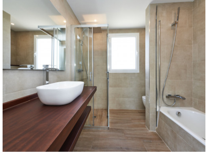
Amplio baño en suite