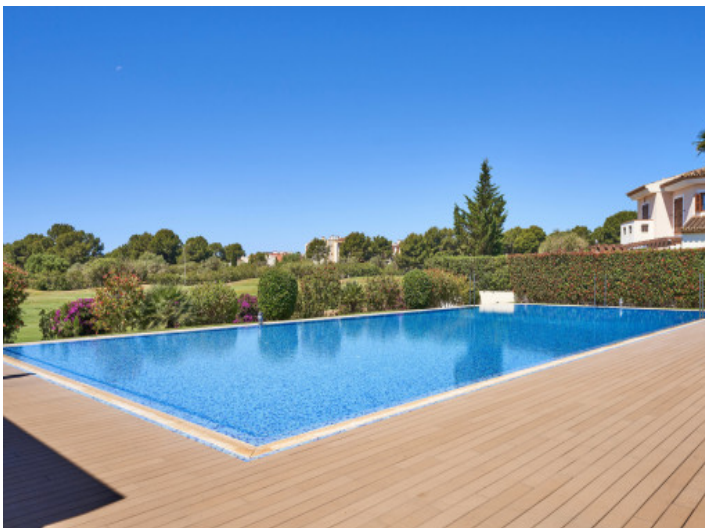
Piscina comunitaria para relajarse