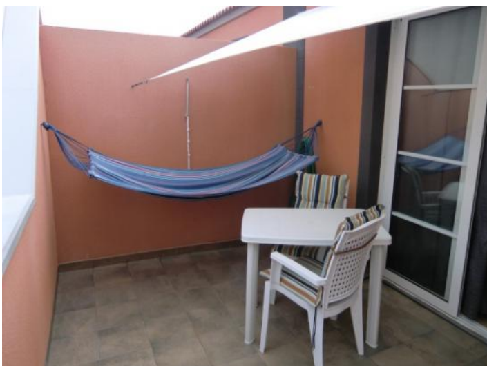
Terraza en planta alta invita a relajarse