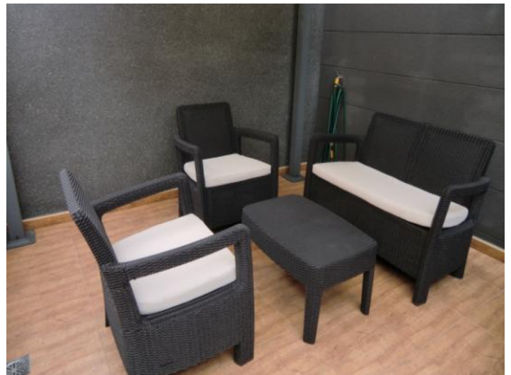
Terraza en la entrada con una zona de estar moderna