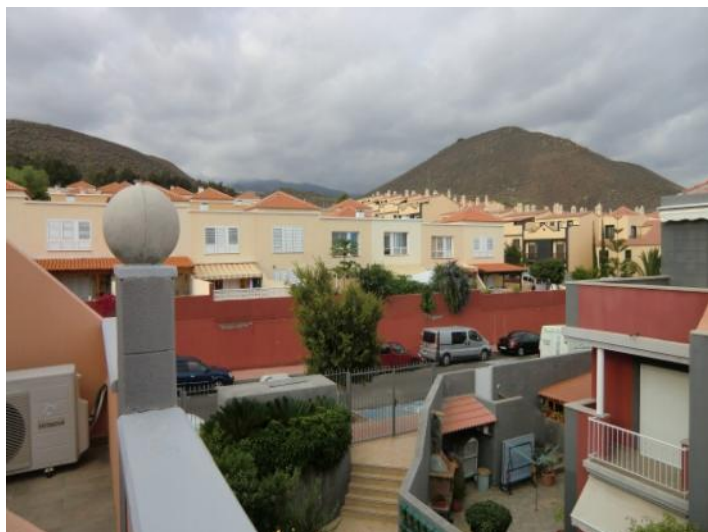
Vistas hermosas a las montañas