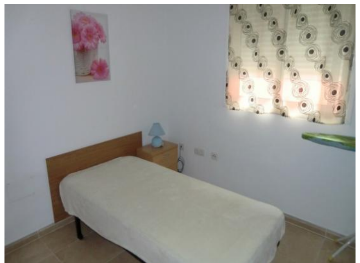
Uno de los tres dormitorios

Toda la información como mejor se puede saber, salvo por error durante el periodo de venta. Sirva este documento como un informe previo, las bases legales solo serán válidas a través de un contrato de compra acordado ante Notario.