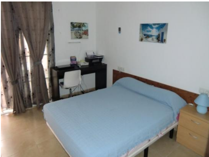
Dormitorio principal con acceso a la terraza