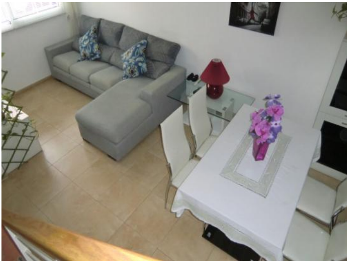
Sala de estar moderna con comedor