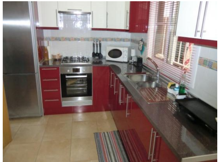
Como nueva cocina totalmente equipada