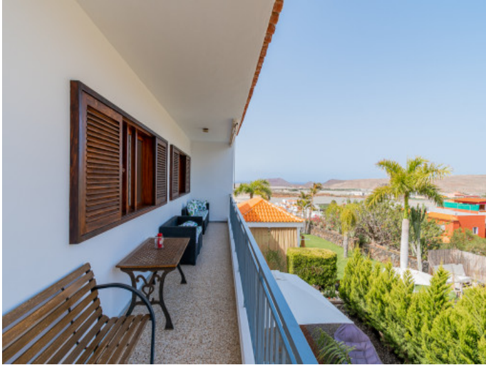
Balcón con vistas