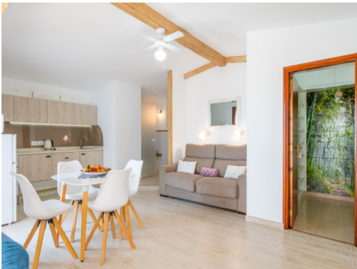
Cocina abierta al salón - comedor