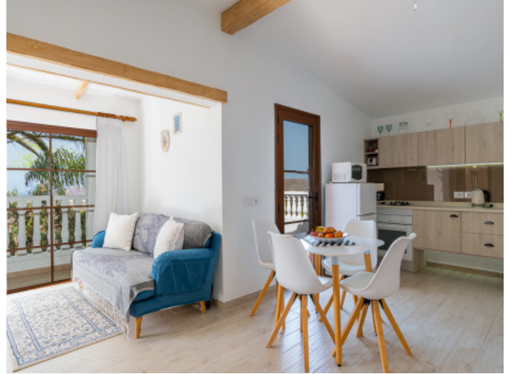
Uno de 4 salones