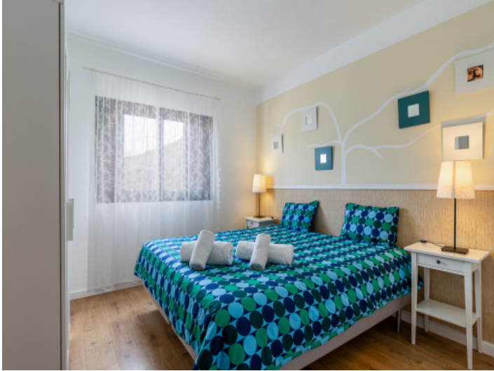
Uno de 10 dormitorios