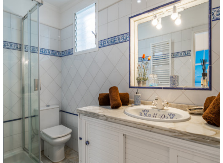
Uno de 5 baños