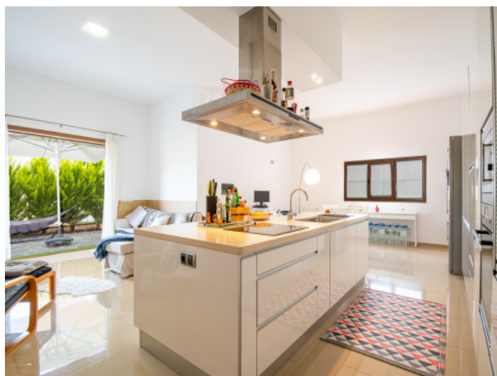
Cocina de uno de los apartamentos