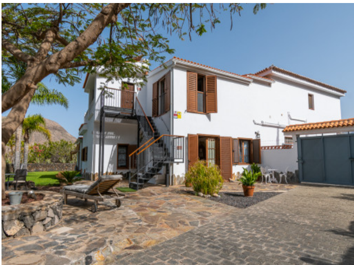
Parking delante de la casa