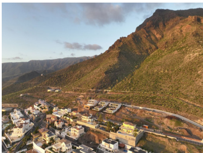
Vistas al campo