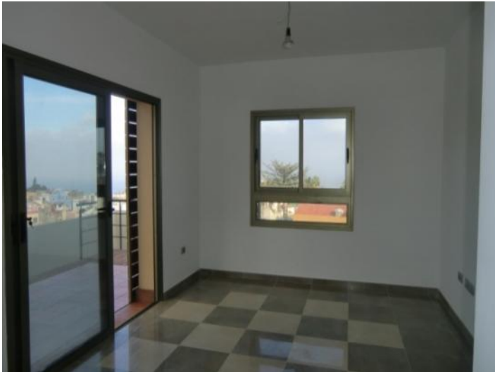
Amplio salón-comedor con zona de comedor, así como vistas al Teide y al