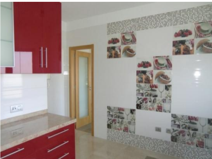
Cocina con zona de comedor y una decoración llamativa