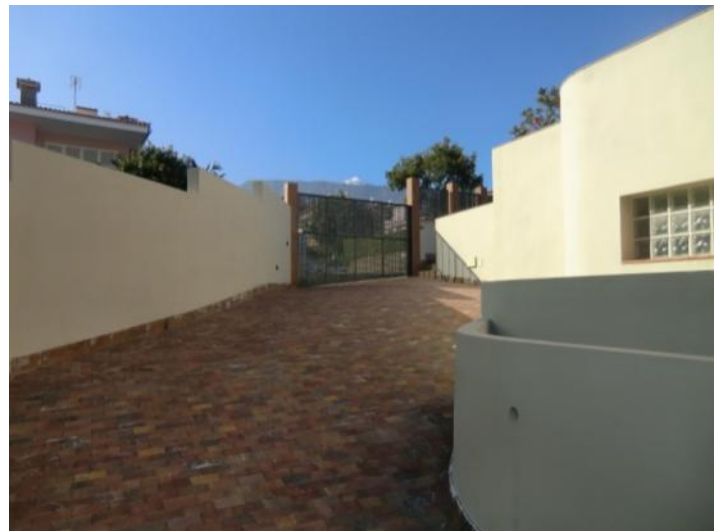
Camino de entrada con puerta automática