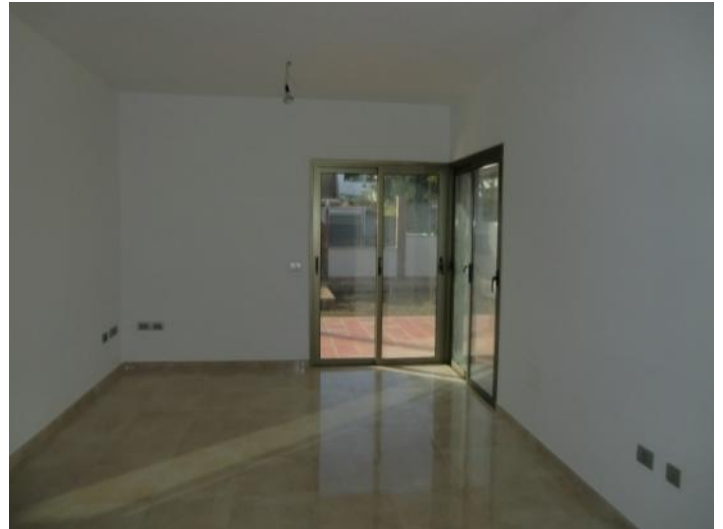
Sala de estar con acceso a la terraza y jardín