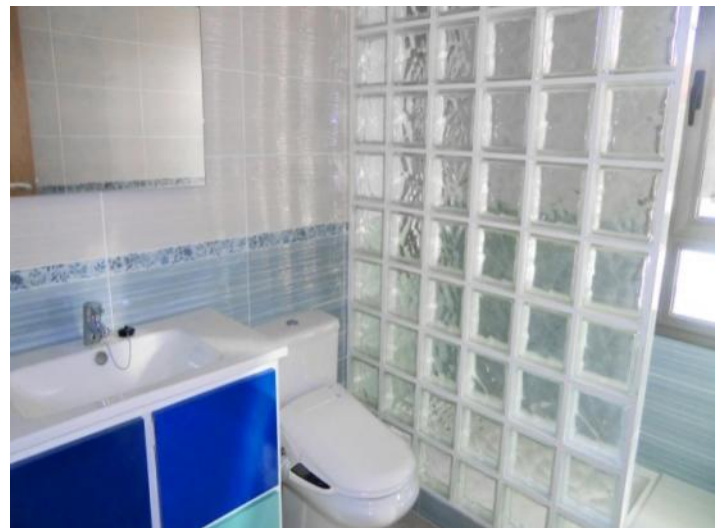
Otro cuarto de baño con un inodoro y ducha de lluvia de autolimpieza

Toda la información como mejor se puede saber, salvo por error durante el periodo de venta. Sirva este documento como un informe previo, las bases legales solo serán válidas a través de un contrato de compra acordado ante Notario.