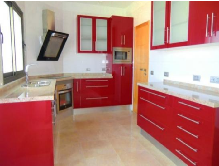
Cocina grande y con estilo elegante