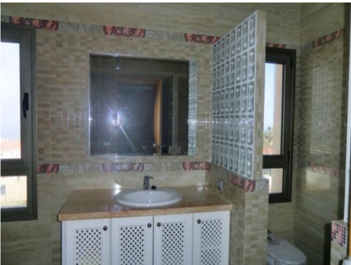
Gran cuarto de baño con ducha de hidromasaje, inodoro y bidé