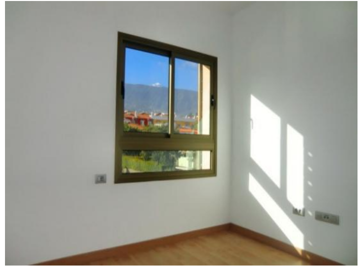
Dormitorio con vistas fantásticas al Teide