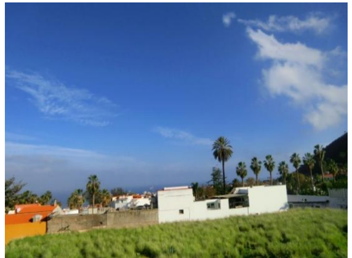
Vistas al Puerto de la Cruz y el Océano Atlántico